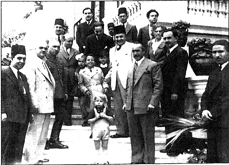
كريم ثابت مع الأمير فيصل (ولى عهد العراق)